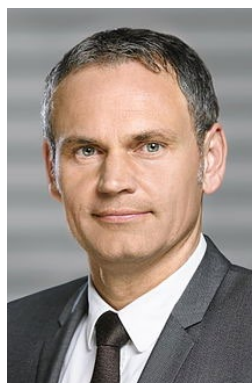
Oliver Blume, CEO, Porsche

Στο επίκεντρο φορολογικής έρευνας των γερμανικών αρχών βρέθηκε η Porsche.