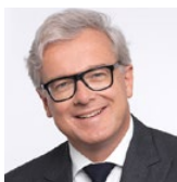
Bertrand Dumazy, CEO, Edenred

Διψήφια οργανική ανάπτυξη σε όλες τις περιοχές και σε όλες τις επιχειρηματικές δραστηριότητες της εμφάνισε η Edenred το 2018. Ο Όμιλος διέθεσε 196 εκατ. ευρώ σε στοχευμένες εξαγορές, ενώ διένειμε συνολικό καθαρό ποσό 165 εκατ. ευρώ σε μέρισμα και προγράμματα εξαγοράς μετοχών, κατά τη διάρκεια του περασμένου έτους.